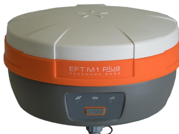
Рисунок 1 – Общий вид аппаратуры геодезической спутниковой EFT M1 PLUS